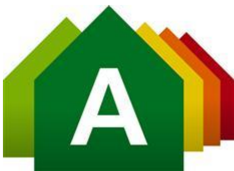
Illustrasjon energikarakter.

I henhold til lov om energimerking av bygningar og bustadar. Energimerkeordninga trådte i kraft 1. juli 2010 med bakgrunn i EU sitt bygningsenergidirektiv.